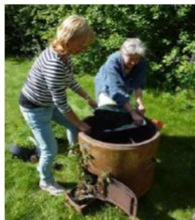
Örtplantering i stationens gamla bykgröta.