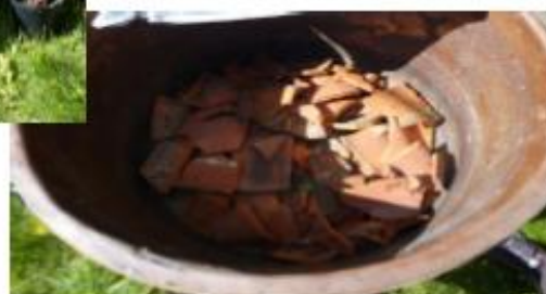
Krossade tegelpannor ersätter lecakulor.

Detta samodlingsprojekt är ett initiativ som uppkommit från Hållbara Järle-träffarna som varit under våren 2013 och fortsätter i höst. Projektet delfinansieras av Leader Bergslagen och vi planerar även att bjuda in till några kurstillfällen under hösten med bl a fokus på hur man tillvaratar lokala råvaror på olika sätt.