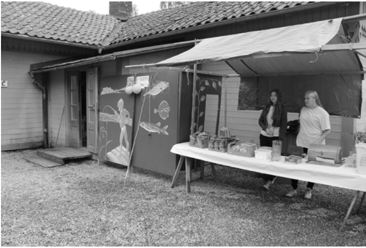
Den nya inlånade fiskdammen från Ervalla Hembyggsförening

sjunga med. Någon ponnyridning blev det inte, istället blev det häst och vagn. Mycket tjustiga både häst, vagn och de som körde och tog betalt.