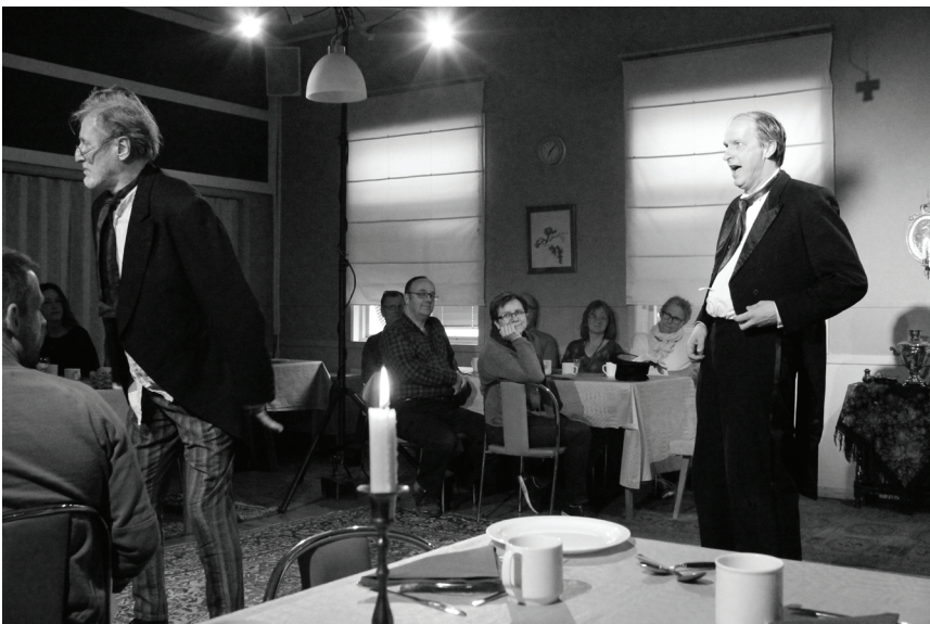
Föreställningen i full gång

Järlegården var ommöblerad med olika attiraljer som dukar, mattor, speglar och kandelabrar så man hamnade mitt i föreställningen. Skådespelarna pratade även med publiken såväl före som under