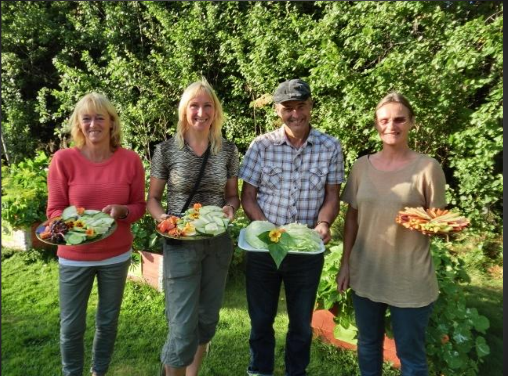
Tillsammans skapar vi "Hållbara Järle"