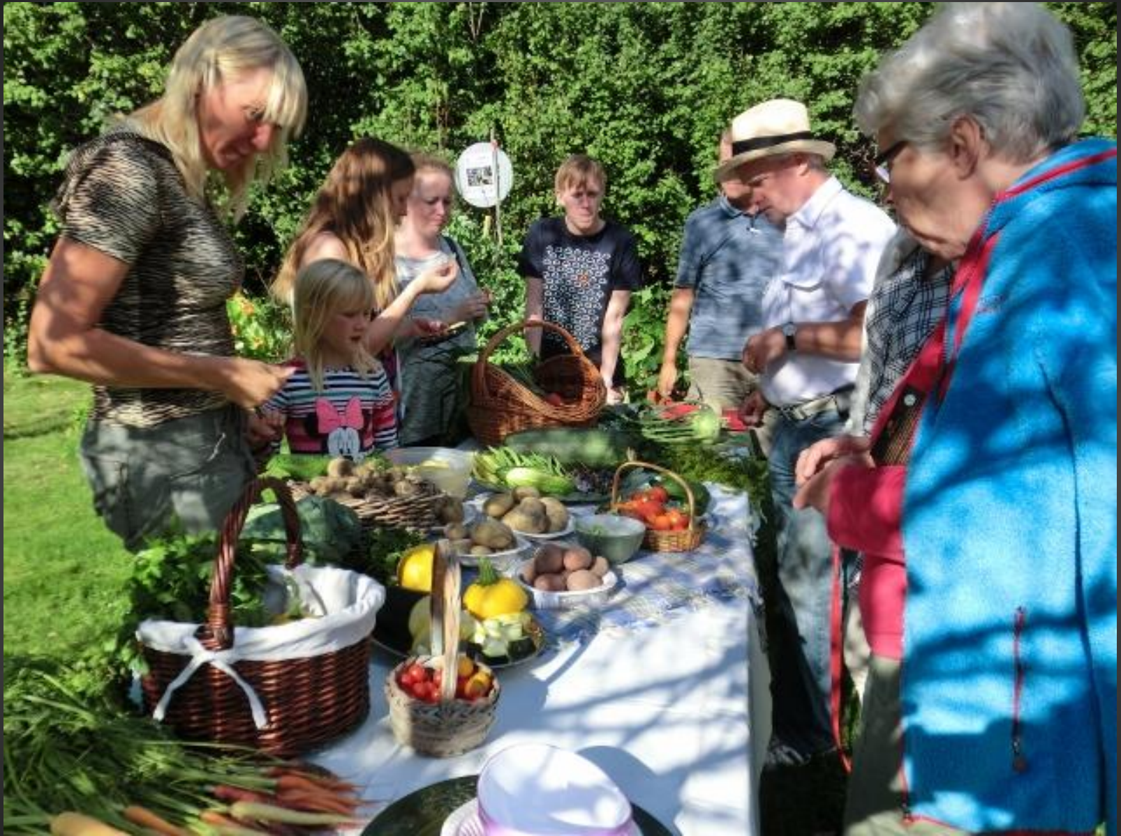
Tillsammans skapar vi "Hållbara Järle"