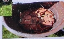
Krossade tegelpannor ersätter lecakulor.

Detta samodlingsprojekt är ett initiativ som uppkommit från Hållbara Järle-träffarna som varit under våren 2013 och fortsätter i höst. Projektet delfinansieras av Leader Bergslagen och vi planerar även att bjuda in till några kurstillfällen under hösten med bl a fokus på hur man tillvarotar lokala råvaror på olika sätt.