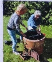
Omplantering i stationens gamla bygröta.

Odlingstema: "Roligt tillsammans, vackert & ätbart"