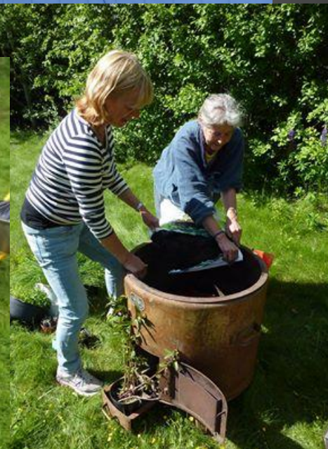
Tillsammans skapar vi "Hållbara Järle"