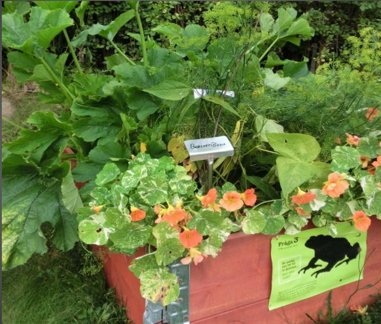
Tillsammans skapar vi "Hållbara Järle"