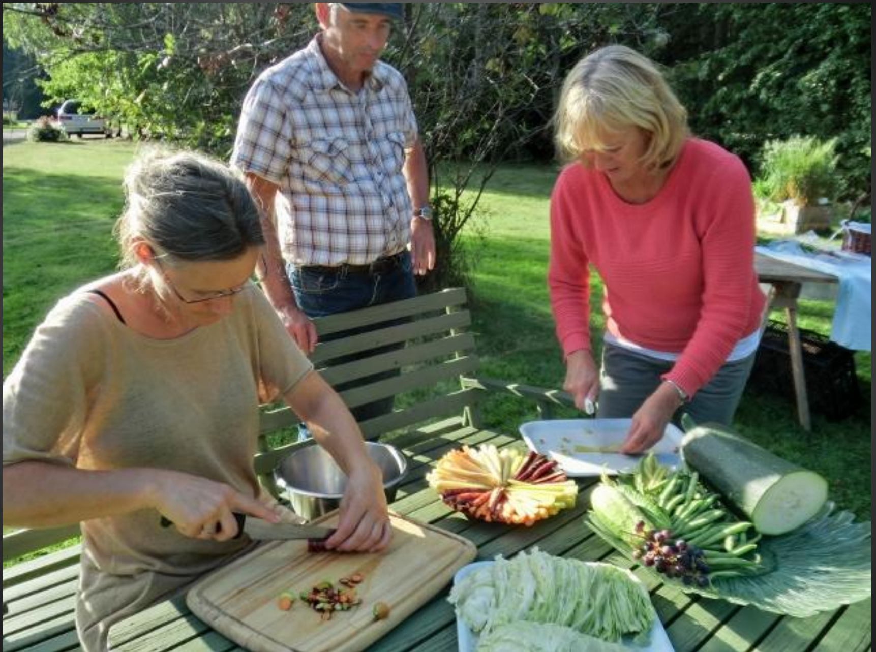
Tillsammans skapar vi "Hållbara Järle"