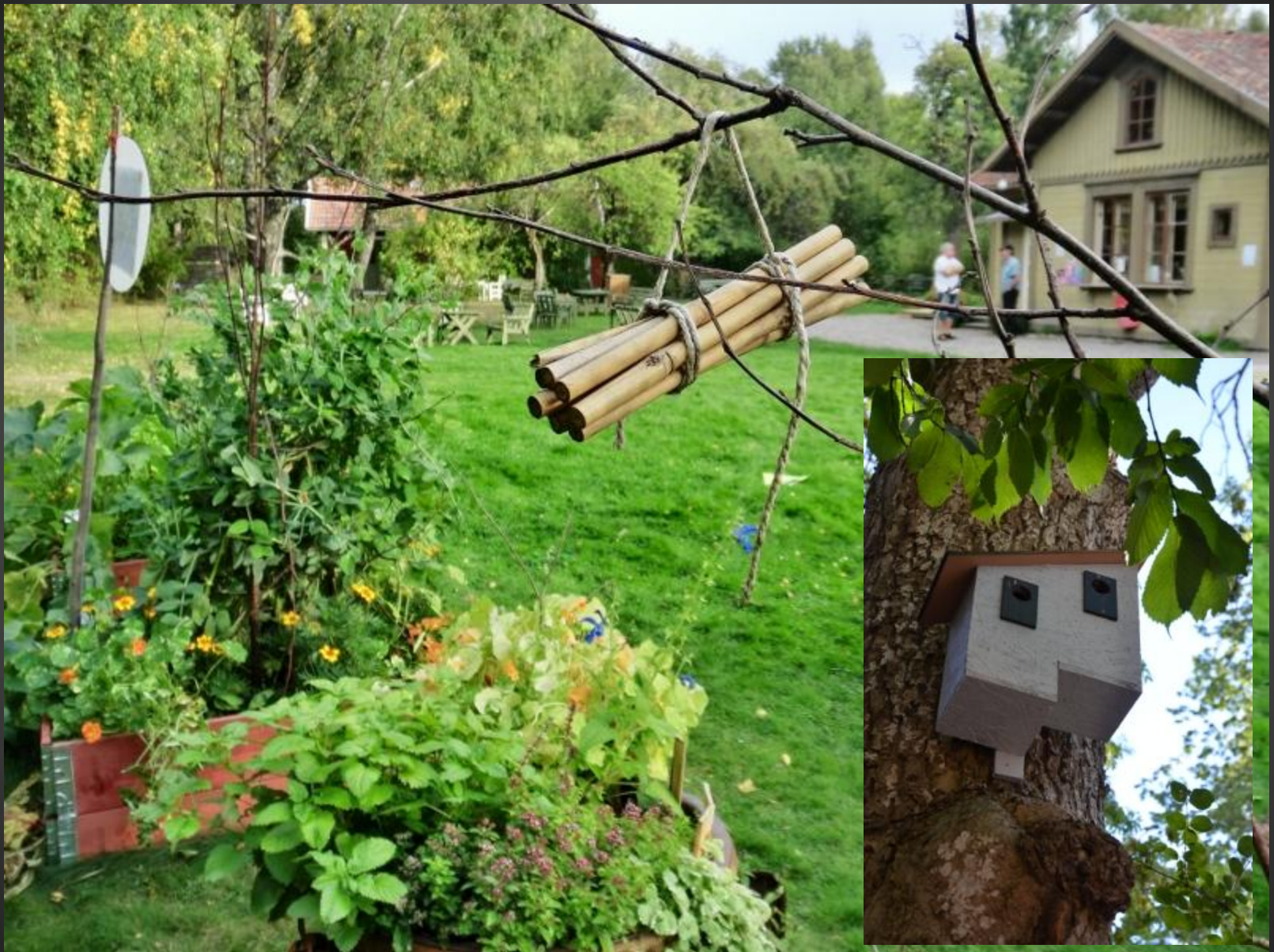
Tillsammans skapar vi "Hållbara Järle"